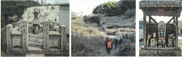
金浦・浜の住吉神社 助実(すげざね)への急登 化粧観音

鮮魚輸送の出発地金浦から吉備高原の麓までの里山をゆく入門コース JR笠岡駅→金浦→助実→古代の丘スポーツ公園→小田川→井原線小田駅 (14.5km 4:00)