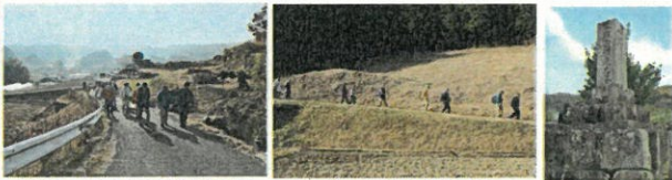
美星・三山の波浪状高原 あずきもちから洗場へ 西林国橋顕彰碑

吉備高原の高みへ登り、ついで日名川の深い渓谷に下り、神楽の里を抜け、古くから一帯の物資の集散地だった成羽へと向かう上下コース。 井原線矢掛駅→(北振バス)→三山→洗場→保木上橋→神楽公園→下日名→成羽→(備北バス)→JR備中高梁駅(16.5km 4:20)