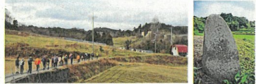
美星・徳山牧場に行く 布東道標