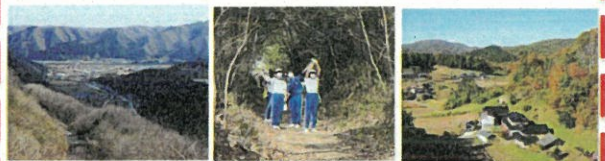
窓坂手前から成羽市街俯瞰 窓坂 宇治・後谷

16体もの神楽像が並ぶ成羽市街を抜け、成羽川を渡るといよいよジャパンレッド・吹屋への急坂コースが始まる。 JR備中高梁駅→(備北バス)→成羽→窓坂→宇治→吹屋→(備北バス)→JR備中成羽駅 (17.5km 6:00)