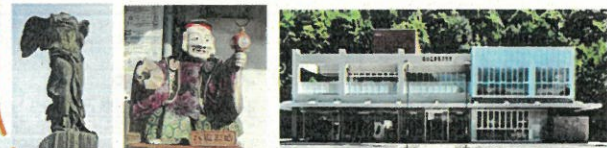
サモトラケのニケ 本丁神楽通り たいこまるプラザ