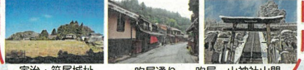
宇治・笹尾城址 吹屋通り 吹屋・山神社山門